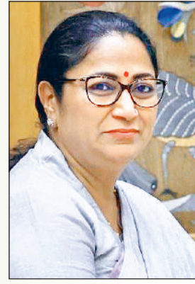
हरिभूमि न्यूज नई दिल्ली

कथित शराब घोटाले मामले में कोर्ट के आए फैसले के संबंध में दिल्ली की मुख्यमंत्री रेखा गुप्ता ने शुक्रवार को कहा कि पूर्व मुख्यमंत्री अरविंद केजरीवाल, दिल्ली की जनता के गुनहगार हैं। मुख्यमंत्री के अनुसार उनके कार्यकाल में सामने आए कथित शराब घोटाले के मामले में निचली अदालत द्वारा दिया गया फैसला अंतिम सत्य नहीं है, बल्कि यह केवल कानूनी प्रक्रिया का एक हिस्सा है। सच्चाई का फैसला होकर रहेगा, इसलिए केजरीवाल घड़ियाली आंसू न बहाएं। मुख्यमंत्री ने कहा कि हम न्यायपालिका का पूरा सम्मान करते हैं और अदालतों के निर्णयों का आदर करते हैं।