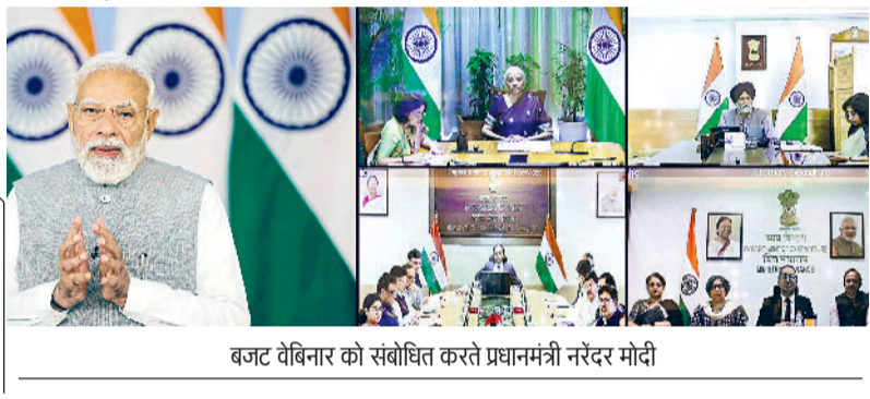
बजट वेबिनार को संबोधित करते प्रधानमंत्री नरेंद्र मोदी

प्रधानमंत्री नरेंद्र मोदी ने "विकसित भारत के लिए प्रौद्योगिकी, सुधार और वित्त" विषय पर बजट के बाद आयोजित वेबिनार में कहा कि राष्ट्रीय बजट कोई शॉर्ट-टर्म ट्रेडिंग डॉक्यूमेंट नहीं, बल्कि दीर्घकालिक पॉलिसी रोडमैप होता है। उन्होंने कहा कि बजट का मूल्यांकन उन नीतियों से होना चाहिए जो इंफ्रास्ट्रक्चर का विस्तार करें, क्रेडिट फ्लो आसान बनाएं, ईज ऑफ डूइंग बिजनेस बढ़ाएं, गवर्नंस में पारदर्शिता लाएं और नागरिकों का जीवन सरल बनाएं। पीएम मोदी ने कहा कि हर बजट राष्ट्र निर्माण की सतत प्रक्रिया का एक चरण है और वर्ष 2047 तक विकसित भारत का लक्ष्य इसी क्रम में आगे बढ़ रहा है। बजट के बाद होने वाले वेबिनार केवल विचार-विमर्श तक सीमित न रहें, बल्कि व्यावहारिक अनुभवों पर आधारित प्रभावी ब्रेनस्टॉर्मिंग का मंच बनें। उन्होंने उद्योग, शिक्षाविदों, विश्लेषकों और नीति-निर्माताओं की संयुक्त भागीदारी को योजनाओं के बेहतर क्रियान्वयन और सटीक परिणामों के लिए आवश्यक बताया।