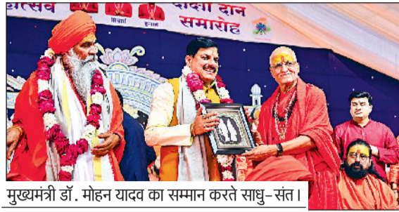
मुख्यमंत्री डॉ. मोहन यादव का सम्मान करते साधु-संत।

मुख्यमंत्री भीलवाड़ा में सनातन मंगल महोत्सव, संत समागम एवं दीक्षा महोत्सव में हुए शामिल